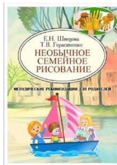
Рис. 7. Необычное семейноерисование