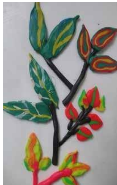
Рис. 4. Лепка листа в технике миллефиори

ющим темам: «Береги нашу Кубань, кукла Кувадка!», «Укачаю свою Пеленашку», «Кукла Кувадка качает моего малыша», «Пирамида Добра» (рис. 3). Родители вместе с детьми вертят тряпичных кукол бешовным способом и в процессе игровой ситуации отрабатывают речевой материал по заданию учителя-логопеда. В это же время педагог-психолог проводит с детьми упражнения по темам: «Волшебный «Бабушкин сундучок», «Запомни 10 куколок».