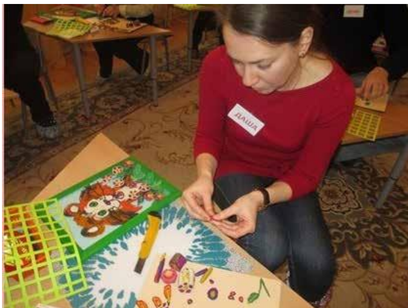
Рис. 5. Мастер-класс для родителей

Результаты изучения проблем речевого развития показали необходимость учить детей манипулировать с разнообразными по качеству и свойствам материалами, ис-