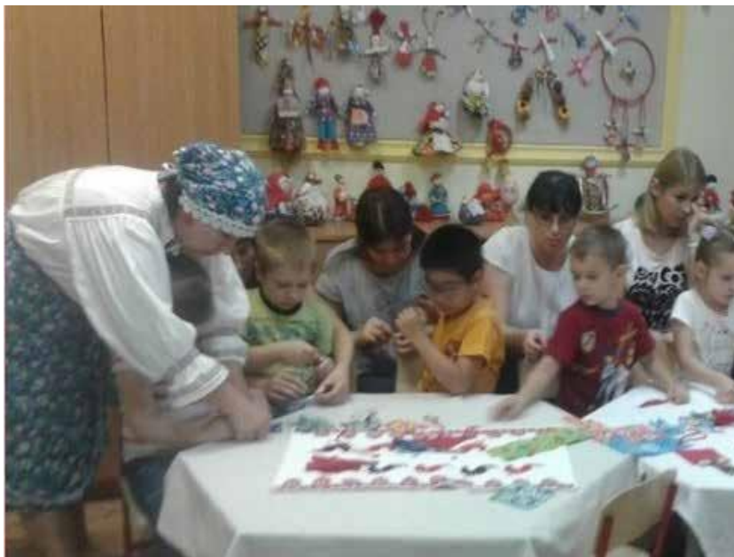
Рис. 3. Береги нашу Кубань, кукла Кувадка!