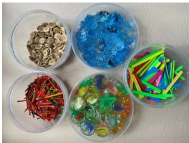
Рис. 5. Материалы для выкладывания букв