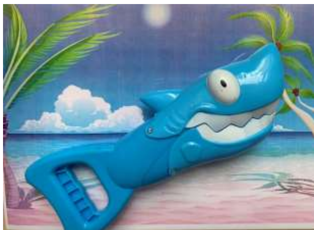
Рис. 2. Игрушка-хваталка «Акула»