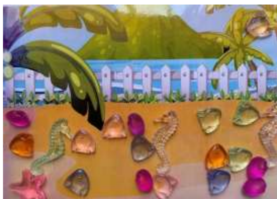
Рис. 4 Камни марлбс в форме морских обитателей