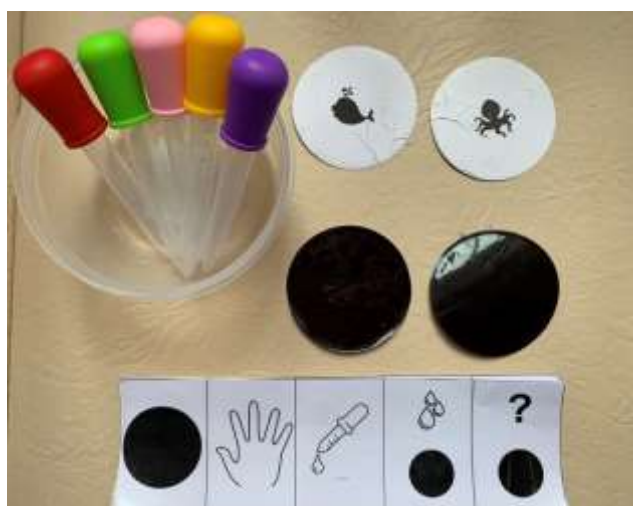
Рис. 3 . Мнемотаблица «Алгоритм оживления рыб», обучающие наклейки и пипетки для творчества