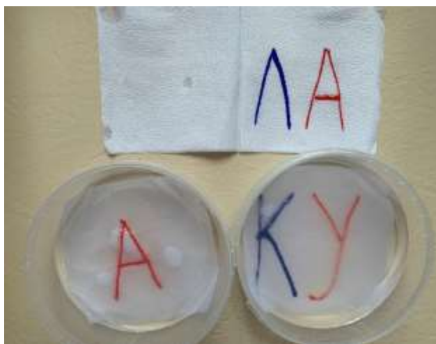
Рис. 1 Сюрпризные салфетки